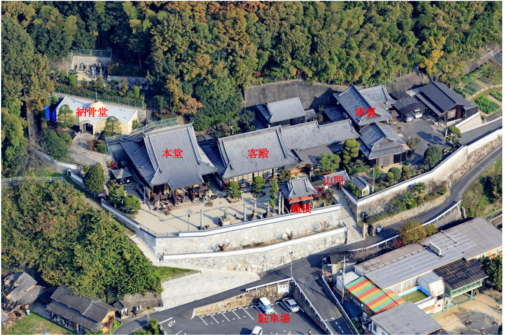
早島インターから般若寺まで約 15 分 インターを降り国道 2 号線を西に、笹沖の交差点を左折南に約 3 キロ、二福小西交差点を左折すぐ