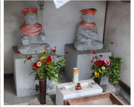
参道坂の下 地元の方が当番で祀っているお大師様とお地藏様