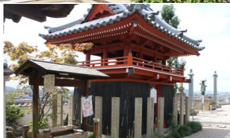
↑鐘楼は元禄時代の創建 元々由伽山蓮台寺にあったが大正年間に移築